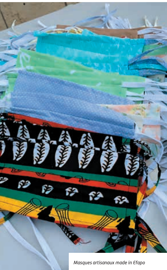
Masques artisanaux made in Efapo