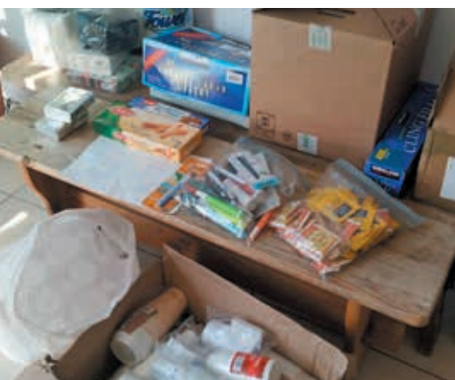
Vaisselle réutilisable, stylos, masques : des objets utiles devenus si rares au cœur du confinement !

dans les hôpitaux, ndr) des masques et des surblouses. On passait chez les Chiroquois pour prendre les sacs de dons. Nous n'avions pas de contacts avec les gens : les sacs étaient déposés devant les portes juste avant qu'on arrive ! » Gestes barrières respectés à la lettre. Les dons étaient ensuite stockés plusieurs jours sans être touchés, et finalement livrés aux hôpitaux. « Nous ne doutions pas de la générosité des Chiroquois. Elle est immense » se félicite la Chiroquoise.