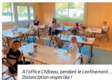
A l'office Château, pendant le confinement... Distanciation respectée !

La jeune femme de 25 ans fait partie des animateurs qui ont accueilli et encadré les enfants des personnels soignants (ou des forces de l'ordre) à l'école Château, pendant tout le confinement. De la mi-mars au 22 mai, elle dit avoir vécu « une expérience très intéressante. On a créé des liens très forts avec les enfants !