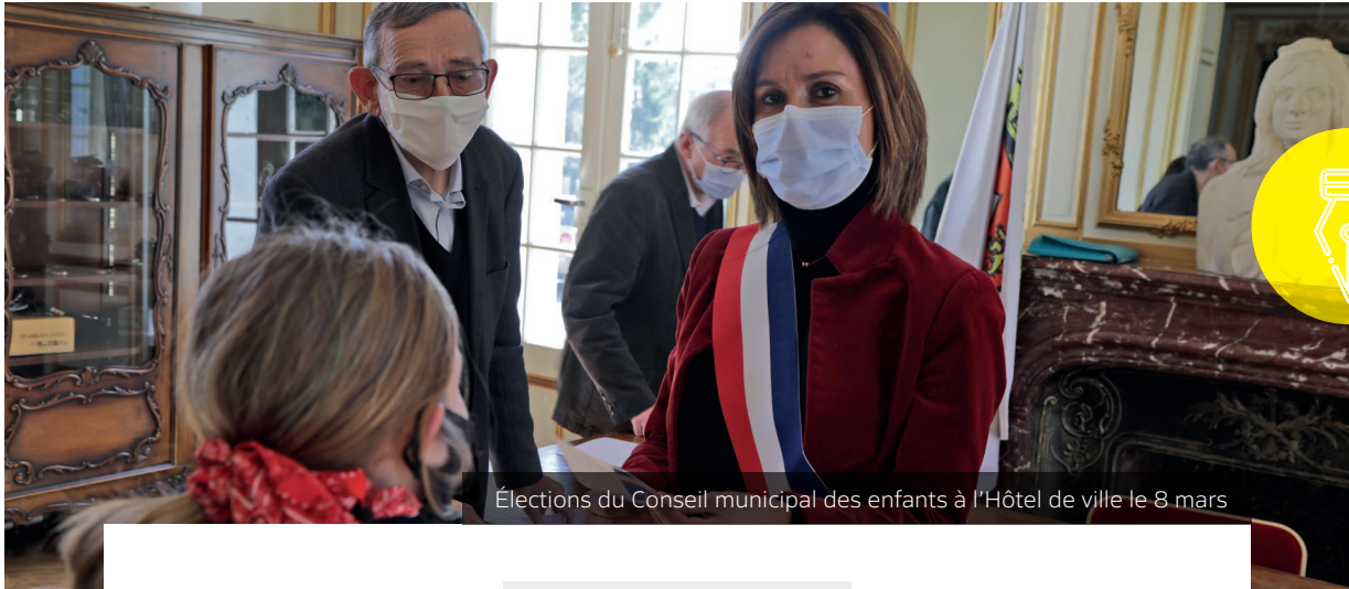
Élections du Conseil municipal des enfants à l'Hôtel de ville le 8 mars