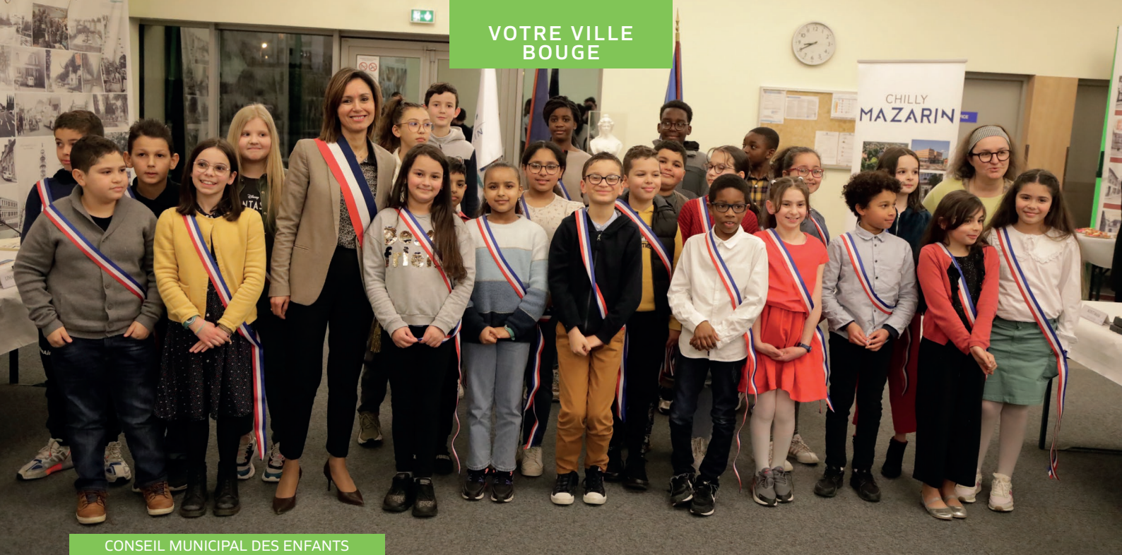
CONSEIL MUNICIPAL DES ENFANTS